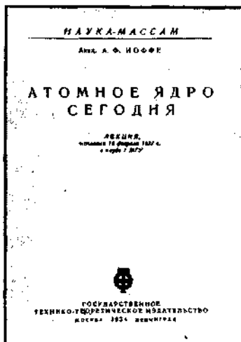
На страницах этой брошюры А. Ф. Иоффе в очень сильных выражениях говорил о достижениях Г. А. Гамова, который к тому времени уже полгода провел за рубежом.

зических институтов. Вместе с тем ограниченные работы Института исключительно столь трудными вопросами, естественно, ставят под сомнение выполнимость такого плана, особенно в течение года. Не зная состава и сил Института, я не берусь судить о количественной величине вероятности выполнения плана, но полагаю, что некоторое сокращение трудных принци-