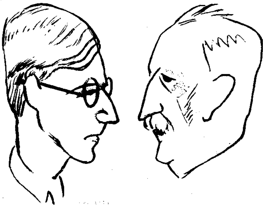
Такими художник увидел Г. А. Гамова и А. Ф. Иоффе на Всесоюзной конференции по атомному ядру в сентябре 1933 г., за несколько недель до их отъезда на Сольвеевский конгресс.