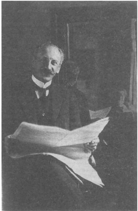
А. Ф. Иоффе в своей квартире в Лесном.

Президиум АН 30 марта поручил Бюро Ассоциации и академикам А. Ф. Иоффе, Д. С. Рождественскому и В. Ф. Миткевичу «проработать вопрос о целевых установках