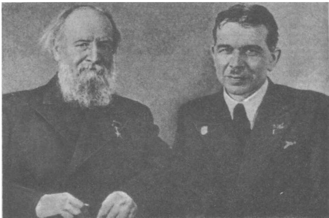
А. Н. Крылов и С. М. Вавилов на юбилейной сессии АН СССР в 1945 г.

альных тем и соответственное увеличение числа тем более конкретных и легких было бы желательным» 11 .