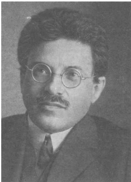
П. С. Эренфест.

граничной командировки к крайнему установленному ему сроку 1 сентября с. г. Ввиду этого прошу об исключении его из списка сотрудников Института» 13 .