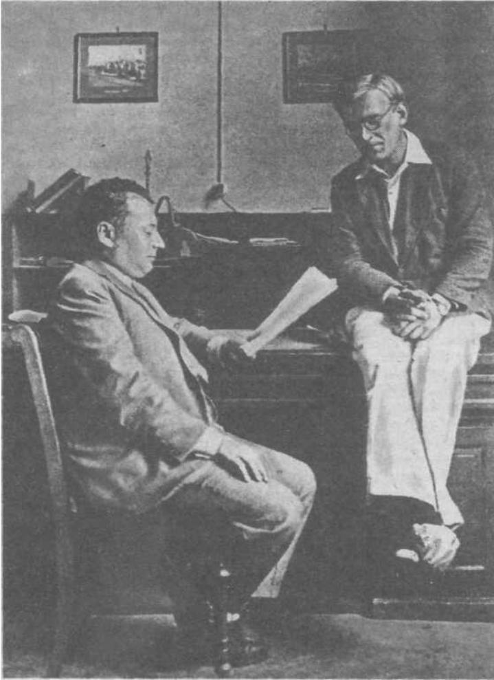
В. Паули и Г. А. Гамов. Цюрих, 1931.

института, задуманного Гамовым, существенно выросли.