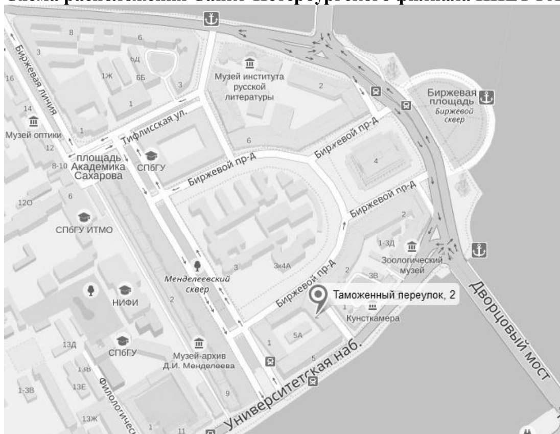
Схема расположения Санкт-Петербургского филиала ИИЕТ РАН

Санкт-Петербург 199034, Таможенный пер., д. 2, конференц-зал ИИЕТ РАН